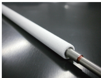
【SSR ロールブラシ形状（絶縁）】