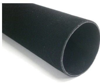
【SSC チューブ形状（導電）】